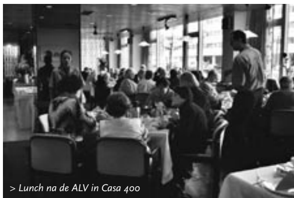
> Lunch na de ALV in Casa 400