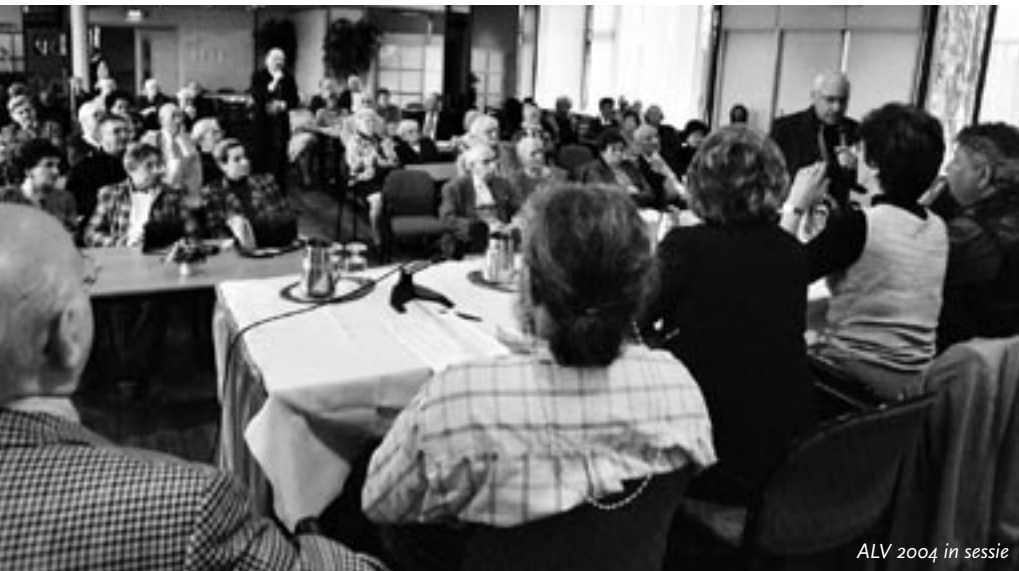
ALV 2004 in sessie