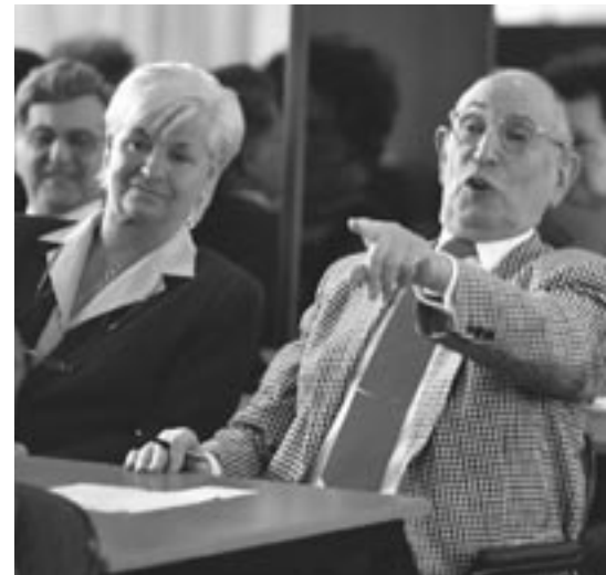
> 'Boekdrukker is de naam!'