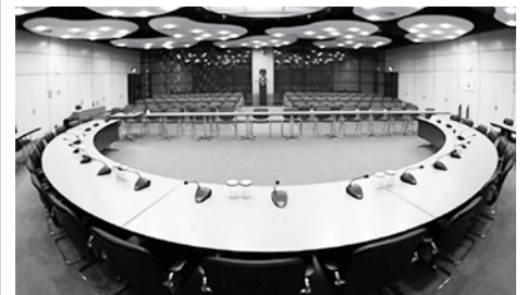
• Een commissievergaderingszaal van de Tweede Kamer

De financiële consequenties zijn beslist niet mis. De overblijvende partner gaat er financieel vaak flink op achteruit. Wij zullen dat hier niet met voorbeelden gaan uitleggen, maar betrokkenen hebben dit aan den lijve ondervonden. De klachten die wij over dit onderwerp krijgen, zijn legio. En terecht. Dit is ook de reden dat dit een van de door ons genoemde pijnpunten is.